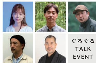
ぐるぐる TALK EVENT

ぐるぐるふくいが県外のアパレルブランドと協業して循環型のアップサイクルプロダクトを販売。全国的なセレクトショップブランド『URBAN RESEARCH (アーバン・リサーチ)』で販売できなくなった衣料、そして世界的なジーンズブランドの『Lee』のサンプル品など、本来なら廃棄される衣料をぐるぐるふくい実行委員会メンバーでリメイクを行い、新しい商品に生まれ変わらせ、限定販売を行います。 ※ Lee は展示のみになります。